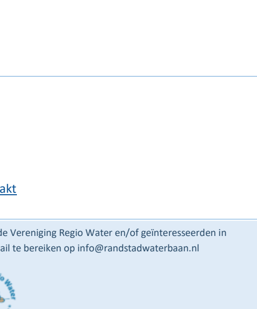
Werk-in-uitvoering via HH Rijnland

buitenzijde van de Goejanverwelledijk opgeknapt en doorgetrokken tot aan de begraafplaats. De dijk wordt ingezaaid met een bloemrijk mengsel.