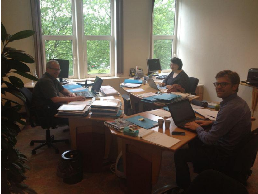
Medewerkers van het verenigingsbureau

Alphen aan de Rijn wordt na de fusie met Boskoop en Rijnwoude lid in 2014. Daarnaast is gestart met een ronde langs circa 15 gemeenten, onder meer in het gebied langs de Oude Rijn, onder meer om deze te interesseren voor samenwerking hetgeen moet resulteren in het lidmaatschap van VRW, overeenkomstig de wens van gedeputeerde Van der Sande.