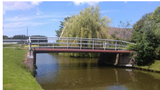
Oosterleese brug bij De Lier in Westland