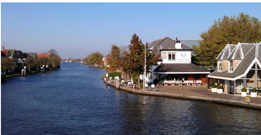
Heijmanswetering die Alphen aan de Rijn verbindt met de Wijde Aa en het Braasemermeer

Tot slot komen zaken juist tot stand door samenwerking. In die zin is VRW een radartje in het geheel.